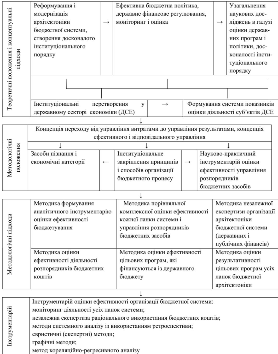
Рис. 3. Концептуальні і теоретичні основи переходу до бюджету орієнтованого на результат в контексті формування нового інституціонального порядку.