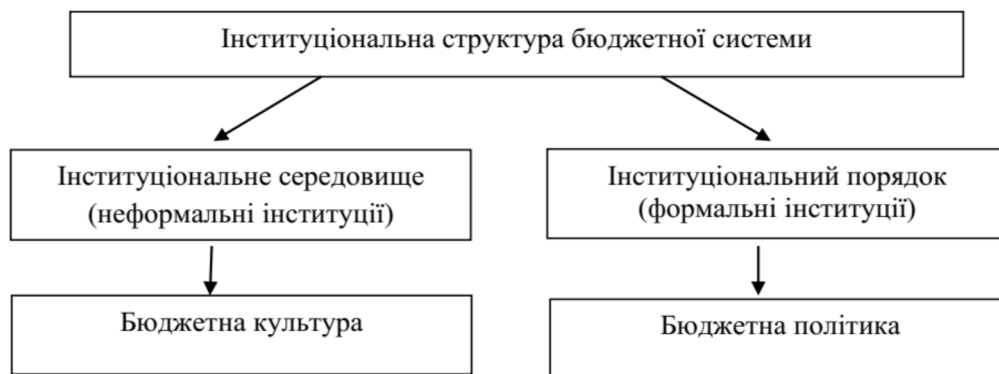
Рис. 1. Інституціональна структура бюджетної системи.

Результати дослідження та обговорення. Досконалий інституціональний порядок одна із стрижневих категорій в методологічному апараті інституціональної структури бюджетної системи (рис. 1).