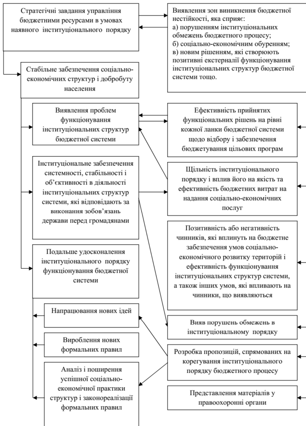
Рис. 4. Інституціоналізація контролю бюджетної системи.

практично, не піддається кількісним оцінкам. Однак можна стверджувати, що від інституцій, які складаються у бюджетній системі, залежить динамічність економічної системи. Тому важливою формою її вдосконалення є систематичне інвестування у нагромадження знань та навичок учасників бюджетного процесу їх моралі.