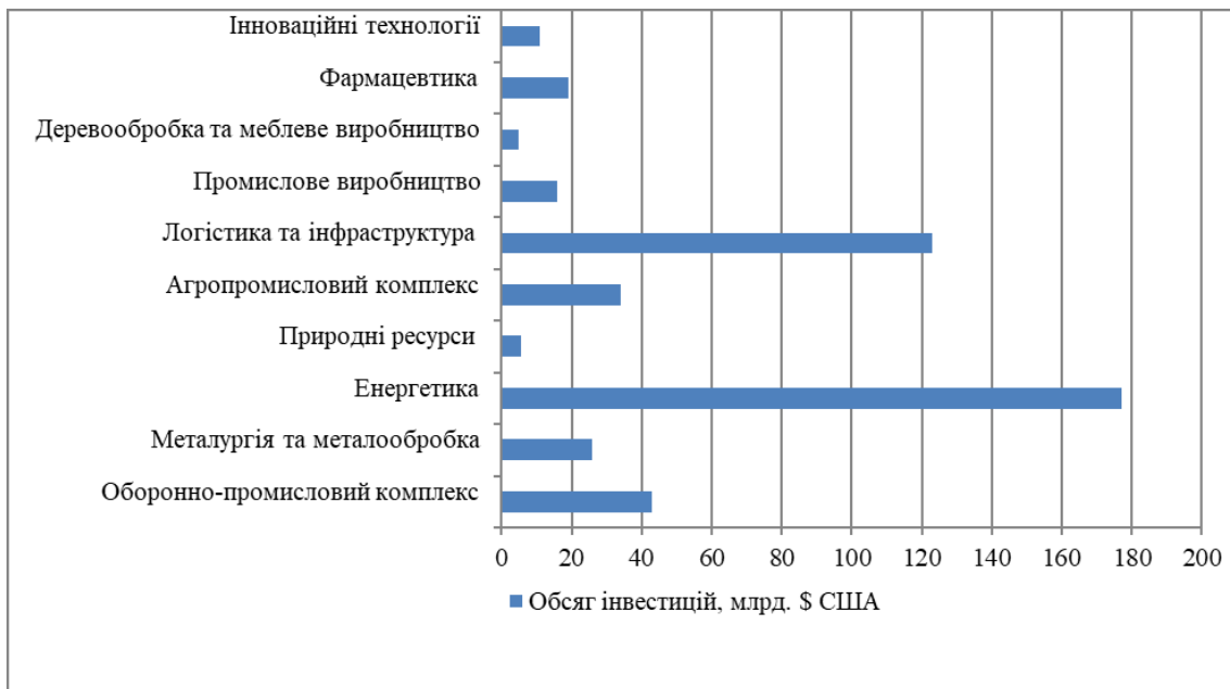
Рис. 2. Інвестиційний потенціал України.