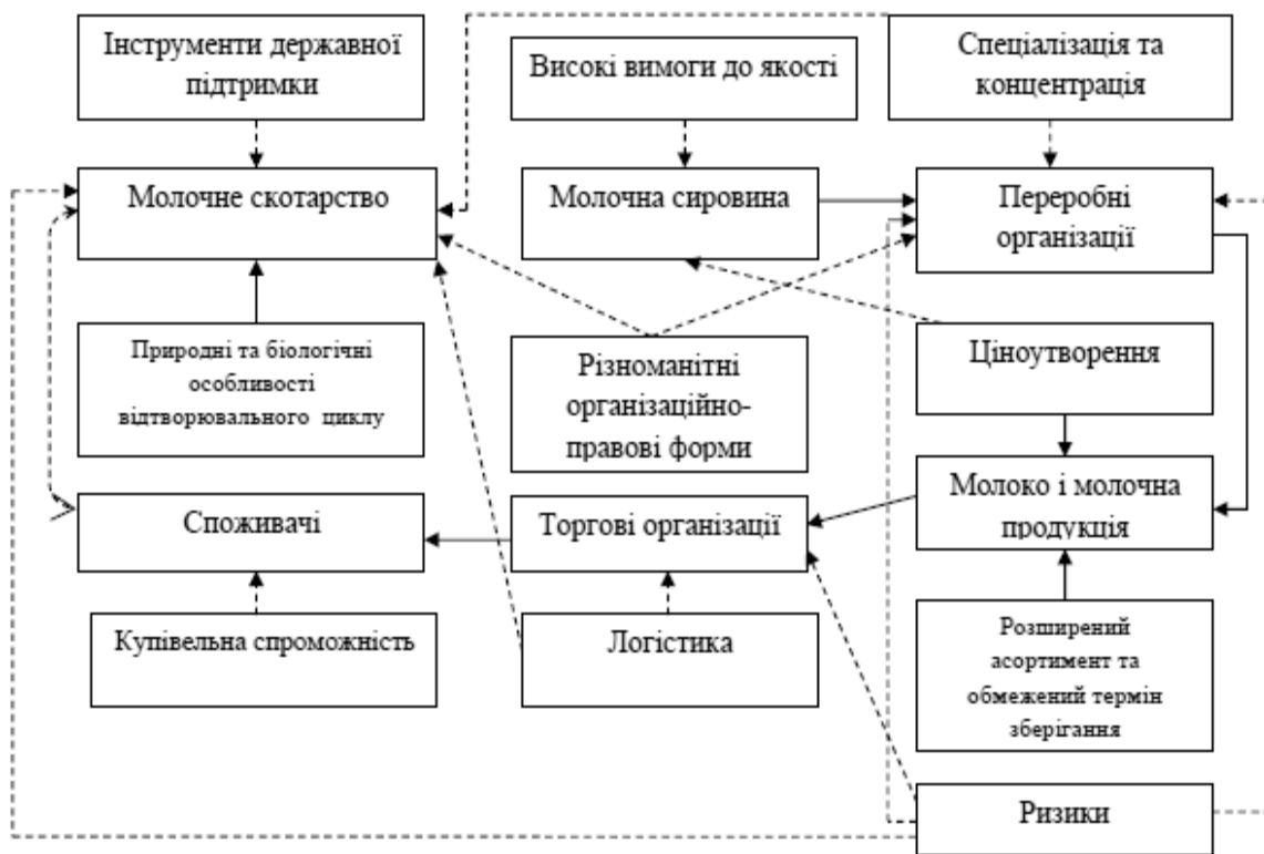
Рис. 1. Учасники молокопродуктового ланцюга поставок та їх взаємозв'язки.