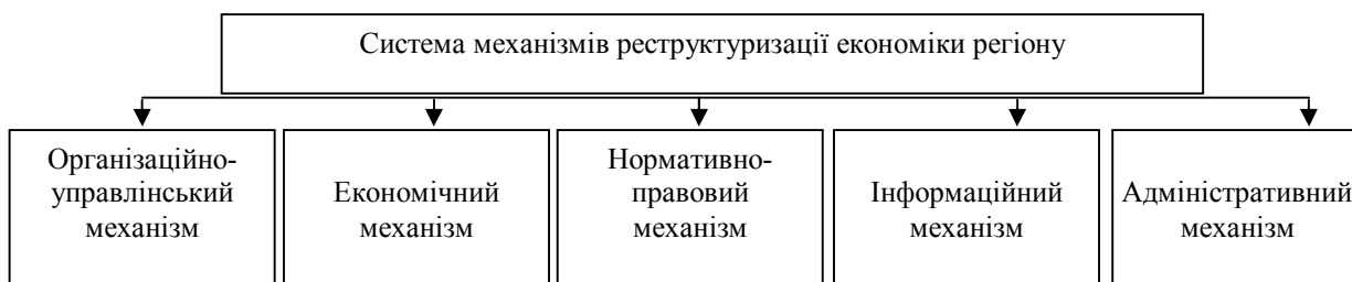
Рисунок 1. Система механізмів реструктуризації розвитку економіки регіону

Узагальнений підхід акцентує увагу на здійсненні необхідних сукупних заходів реструктуризації, включаючи засади політик, інструментів, важелів та методів впливу, проте він не деталізує сукупність та зміст механізмів здійснення реструктуризації (рис. 1).