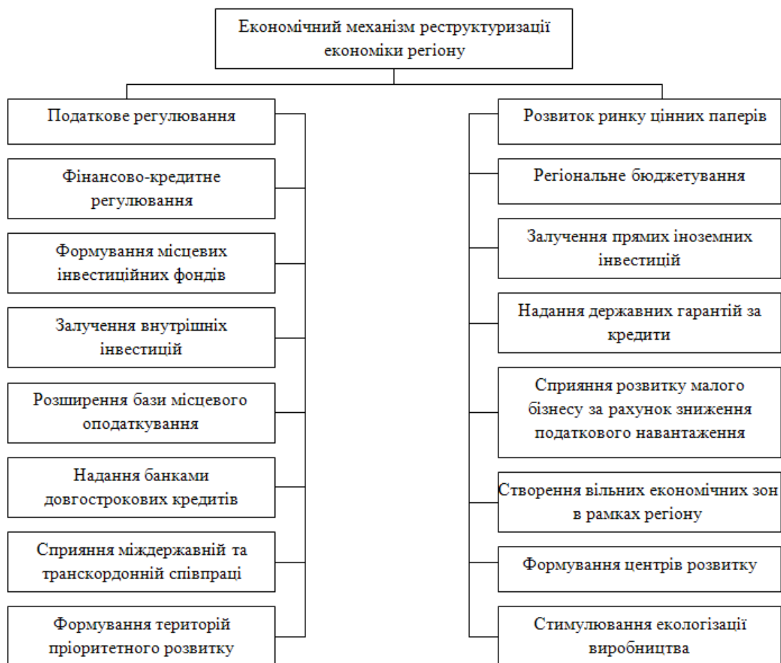
Рисунок 4. Структура економічного механізму реструктуризації економіки регіону

Акумуляція фінансових ресурсів до місцевих фондів розвитку з боку бізнесових структур регіону буде сприяти фінансуванню науково-виробничих розробок та впровадженню у виробництво інноваційних проектів.