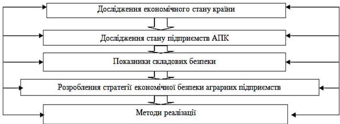
Рисунок 2. Комплексна модель забезпечення економічної безпеки аграрних підприємств

втілення стратегічного управління на підприємствах розглядається нами як один із важливих напрямків забезпечення економічної безпеки.