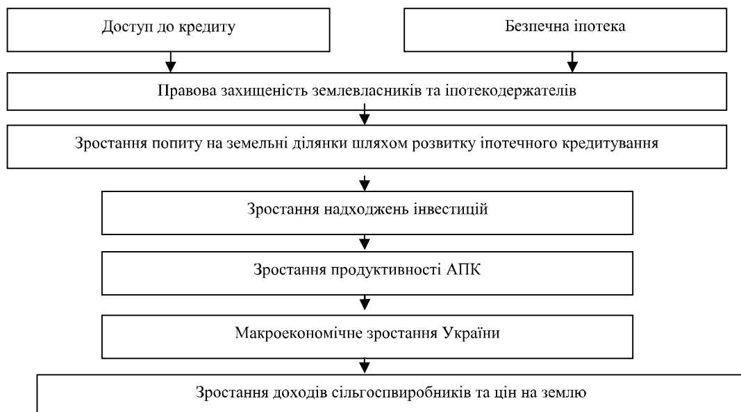
Рис. 3. Результативність забезпечення іпотечного кредитування

Позитивною стороною функціонування ринку землі є можливість зробити оцінку землі більш прозорою та об'єктивною, що дозволить забезпечити зростання іпотечних інвестицій за рахунок кредитування (рис. 3).