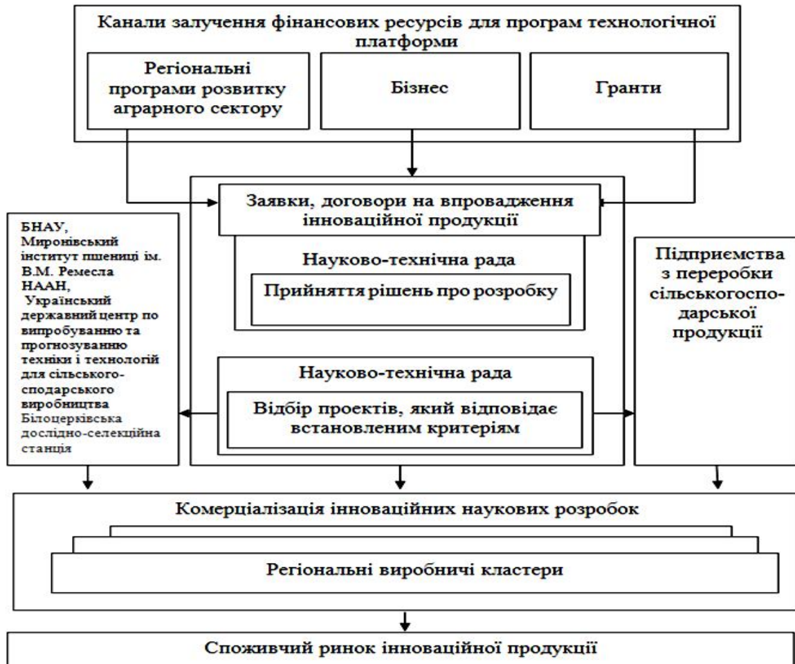
Рис. 2. Структура взаємодії учасників центру з розробки та впровадження інновацій

Особливої підтримки потребують ОСГ та ФСГ в частині навчання основам ведення аграрного бізнесу, забезпечення доступу до бази даних з придбання і використання виробничих ресурсів, реалізації продукції, сприяння обміну досвідом, вирішення юридичних і фінансових питань. Саме в цьому плані діяльність інформаційно-освітніх інноваційних центрів буде досить ефективною (рис.2).