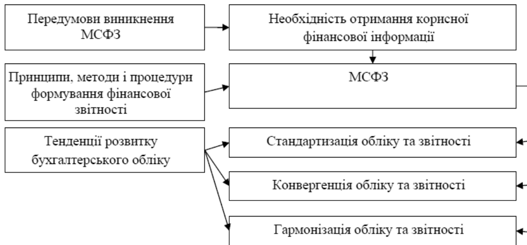
Рис. 1. Місце МСФЗ у процесі розвитку банківської системи.