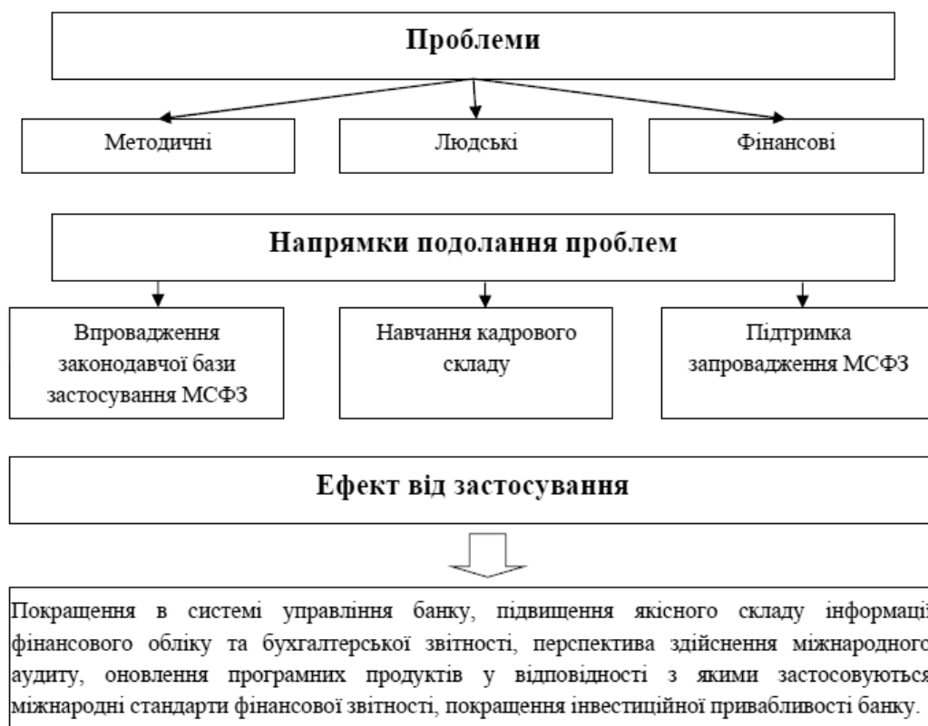
Рис. 3. Пропоновані елементи процесу коригування національної банківської звітності до потреб МСФЗ.

Серед основних ризиків повного впровадження МСФЗ в банківських установах України, на наш погляд, варто виділити: 1) внутрішні – збільшення кількості користувачів фінансової інформації; зміст корпоративної звітності (інтегрованої, нефінансової, управлінської), політика перевірки корпоративної звітності; 2) зовнішні – фінансові ризики; небезпека швидкої інтеграції на міжнародні фінансові ринки; процентні ризики.